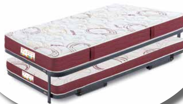
Colchones Junior + Cama Nido F2

Total colchón: 20 cm. Total bloque: 14 cm.